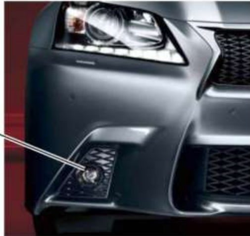
High grade LED front fog lamp

diseño más pequeño, más innovador pero a su vez con mejor y más potente iluminación